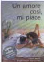
Un amore così, mi piace VHS + libro, Celeste Film, San Paolo, € 14,50

I metodi naturali sono affidabili? Chi può utilizzarli? Come imparare a conoscerli? Nel video «Un amore così, mi piace» vengono presentati con un linguaggio vivace, fresco e accattivante, attraverso l'intervento di medici e specialisti e la testimonianza di donne e coppie che li utilizzano. Corredato anche da un libro, che funge da supporto didattico.