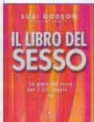
Il libro del sesso Suzi Godson, Mel Agace, Sonzogno, € 24,00