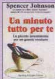
Un minuto tutto per te Spencer Johnson, Sperling & Kupfer Editori, € 10,50

«Posso fare qualcosa di meglio per prendermi cura di me in questo preciso istante?» è la domanda centrale che tutti possiamo fare a noi stessi, più volte al giorno, per imparare a vivere meglio e sviluppare rapporti migliori con gli altri. Lo afferma Spencer Johnson, già autore del best seller L'One Minute Manager , che ha insegnato a un'intera generazione come affrontare in «un minuto» le questioni più spinose della nostra esistenza. Un modello di non poca importanza per chi vive velocemente ma non vuole rinunciare a niente. In un dialogo tra un uomo d'affari e uno zio che può vantare un successo a 360 gradi, l'autore ci illustra come diventare persone migliori in tutto quello che facciamo ed essere più felici da soli e con gli altri.