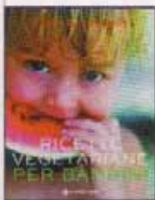
Ricette vegetariane per bambini , Nicola Graimes, Tecniche Nuove, € 18,90

Un approccio davvero soft alla cucina vegetariana, senza eccessive preclusioni, questo libro dedicato ai bambini, ma ricco di idee sfiziose e nutrienti per chiunque ami frutta e verdura. Ricette basate su ingredienti reperibili ovunque, che non richiedono laboriose preparazioni, con sezioni specifiche su prime colazioni, spuntini, picnic, dolci e bevande gustose.